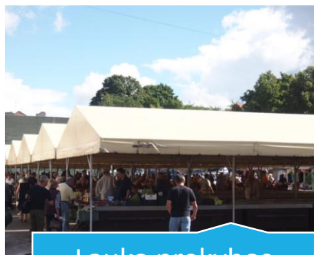
Lauko prekybos stoginės

UAB „Senasis turgus“ veikla yra prekybos organizavimas ir prekybos vietų nuoma mažmeninės prekybos įmonėms ir individualiems prekiautojams. Pirkėjams siūlomas asortimentas: ekologiškos prekės, privačiuose Lietuvos ūkiuose užaugintos uogos ir daržovėmis, medus ir jo gaminiai, miško gėrybės, sezoniniai ar egzotiniai atvežtiniai vaisiai ir daržovės, mėsos ir pieno gaminiai ir kt. kulinarijos paveldo fondų gėrybės. Turgaus pavasario sezono išskirtinumas: didelis daigų, sodinukų pasirinkimas. Lauko prekybos stoginėse vyksta ir ne maisto produktų prekyba (galanterija, trikotažas, avalynė ir kt. prekės).